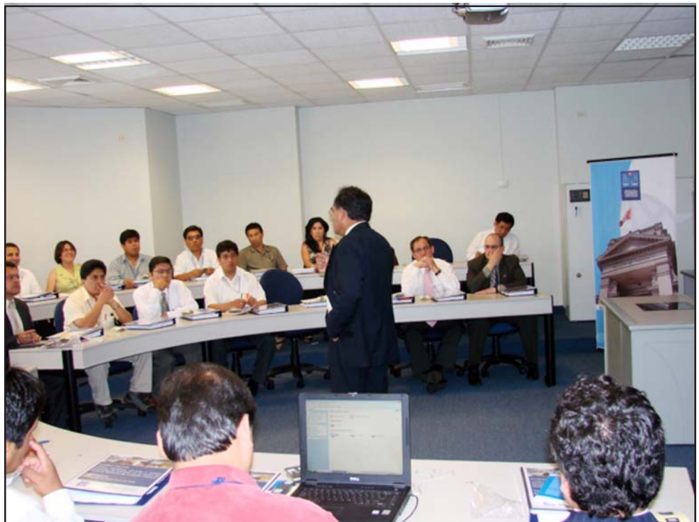
El programa de especialización se diseñó especialmente para el Poder Judicial al que asisten 36 trabajadores elegidos por sus cualidades profesionales en sus respectivas Cortes Superiores de Justicia

Frente a esto, uno de los sistemas que ha ocasionado la mayor polémica entre las instituciones del Estado es el SNIP que indica que toda intervención limitada en el tiempo que utiliza recursos públicos, con el fin de crear, ampliar, mejorar, modernizar o recuperar la capacidad productora de bienes y servicios, requiere previo a su ejecución, la preparación de estudios de pre inversión la cual deberá