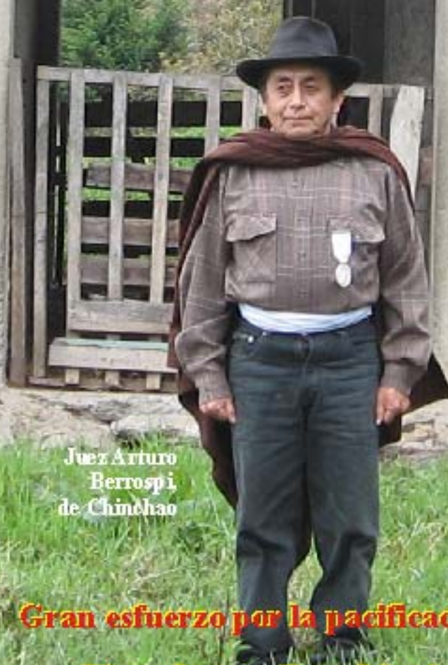
Juez Arturo Berrospi de Chinchao