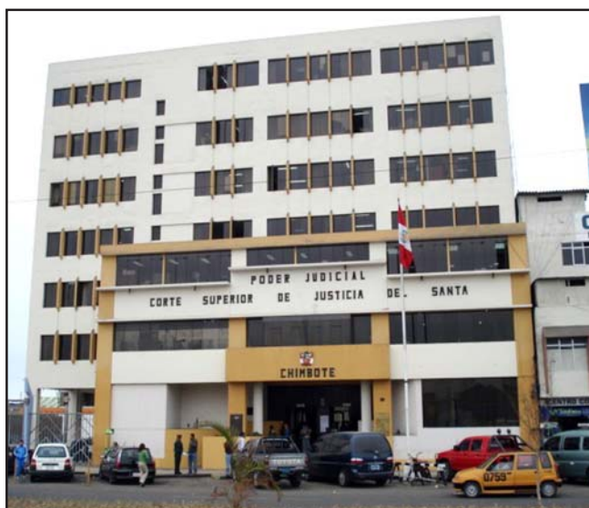
Sede de la Corte Superior de Justicia del Santa en Chimbote