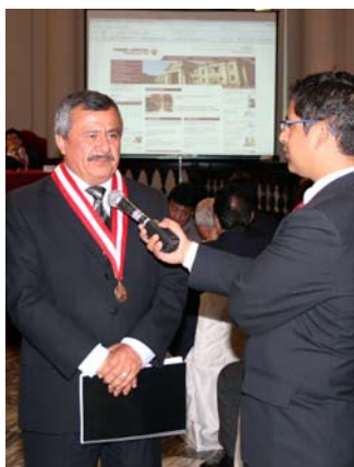
El doctor Francisco Távora Córdova, informa al país sobre el lanzamiento del Registro de Deudores Morosos (REDAM).