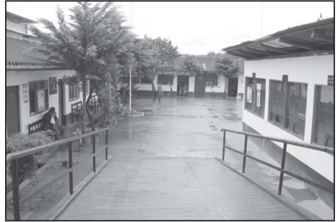
Ingreso a la sede de la Corte Superior de Justicia de Amazonas en la ciudad de Chachapoyas