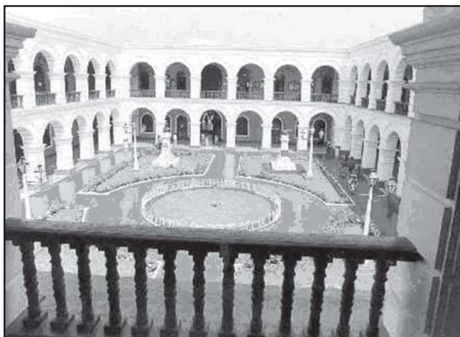
Sede de la Corte Superior de Justicia de La Libertad

En la cita, informaron al doctor Távora sobre las acciones y propuestas que el Equipo Técnico presentó al Consejo Ejecutivo del Poder Judicial a fin de superar algu-