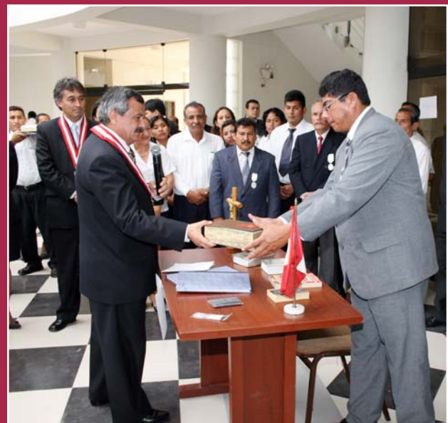
Entrega simbólica de una Biblia a los Jueces de Paz