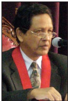
Doctor Pedro Cueto, Presidente de la Corte Superior del Callao.

Dirección: Avenida . Dos De Mayo Cuadra 5 S/N, Callao Teléfonos: 453-3602 / 429-4027 / 453-3620 / 453-3619 / 465-4511 / 453-3601