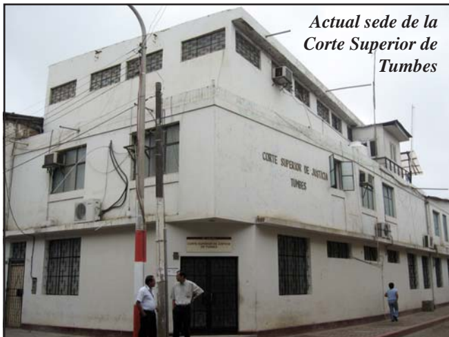
Actual sede de la Corte Superior de Tumbes