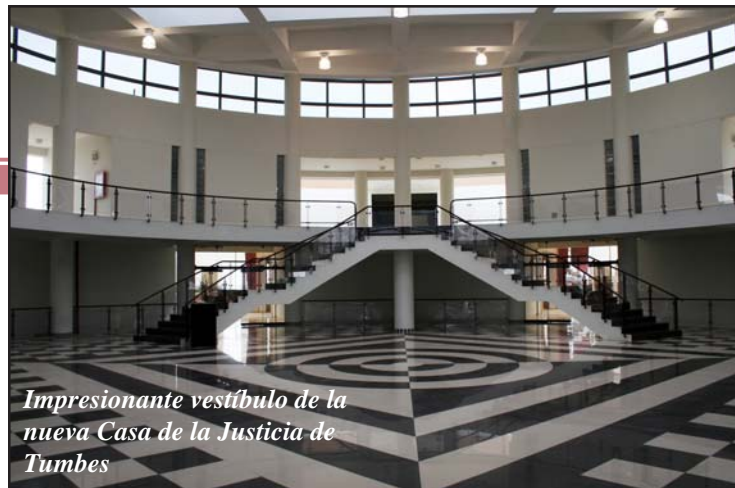
Impresionante vestíbulo de la nueva Casa de la Justicia de Tumbes