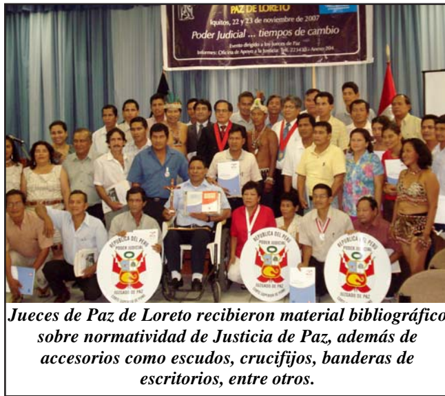
Jueces de Paz de Loreto recibieron material bibliográfico sobre normatividad de Justicia de Paz, además de accesorios como escudos, crucifijos, banderas de escritorios, entre otros.

Con el propósito de fortalecer las capacidades de los jueces de paz en los temas de su competencia y de posibilitar a la población un mayor acceso a la justicia, la Corte Superior de Justicia de Loreto, con apoyo del Proyecto de Apoyo a la Reforma del Sistema de Justicia - Proyecto JUSPER, realizó el pasado 22 y 23 de noviembre el XIII Encuentro de Capacitación Jueces de Paz de Loreto, en el Auditorio de la Corte de dicho Distrito Judicial. Gracias a esta iniciativa, 39 Jueces de Paz de las provincias de Requena, Contamana, Ramón Castilla, Indiana, Sarayacu y otros lugares pertenecientes de la Jurisdicción de Loreto, se capacita-