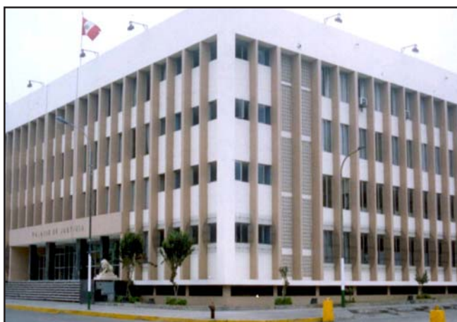
Sede de la Corte Superior de Justicia del Callao.