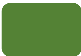
Mesas de Atención Interinstitucional