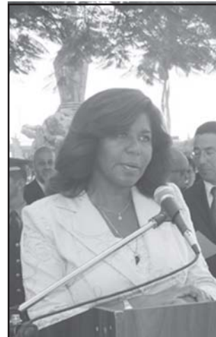
Ministra de Justicia, doctora María Zavala representó al Poder Ejecutivo

Esta nueva experiencia permitirá, tanto al Poder Judicial, como al Poder Ejecutivo, obtener mayores datos factuales sobre que caminos debe seguir la plena vigencia de la citada Ley penal, que inaugura una nueva justicia para nuestra nación.