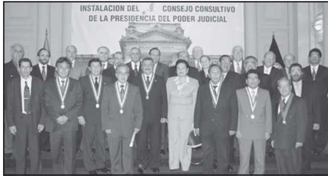
Miembros del Consejo Colstivo reunidos en la Sala de Juramentos del Palacio de Justicia

Veinticuatro destacados juristas se reunieron el pasado 28 de marzo, convocados por el Presidente de la Corte Suprema de Justicia, doctor Francisco Távara Córdova, para constituir el Consejo Consultivo de la Presidencia del Poder Judicial y contribuir con su experiencia y conocimiento a la buena marcha de la reforma de este Poder del Estado.