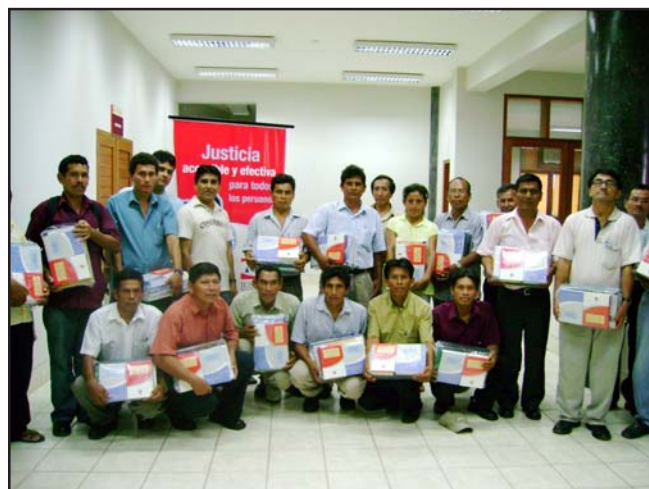
Jueces de Paz del Distrito Judicial de Ucayali muestran el material bibliográfico básico sobre normatividad referida a la Justicia de Paz, que incluye Constitución del Estado, Ley Orgánica del Poder Judicial, Códigos Civil y Penal, Biblia y otros.