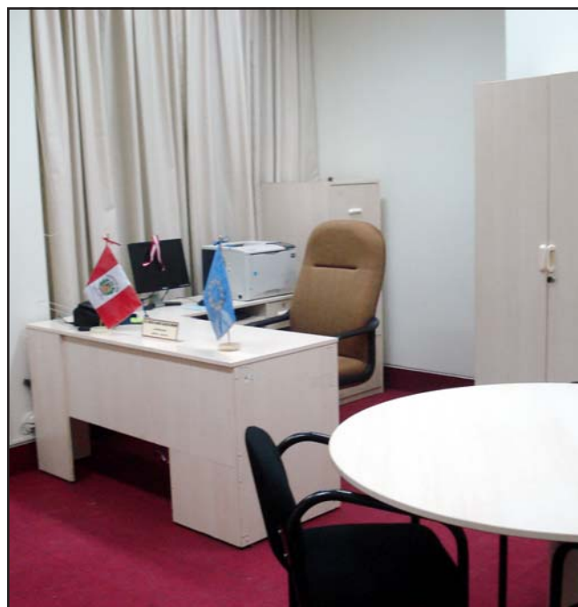
Oficina Distrital de Apoyo a la Justicia de Paz del Distrito Judicial de Ucayali, implementada con equipo informático (computadora e impresora), escritorio, silla, muebles de archivo y la mesa de trabajo para los jueces de paz que visitan la ODAJUP.

Se espera lograr que los magistrados dispongan de lineamientos jurisprudenciales sobre la aplicación del derecho en las diferentes materias, para elevar el nivel de predictibilidad y en consecuencia, producir una administración de justicia más confiable ante abogados, litigantes y la sociedad en general.