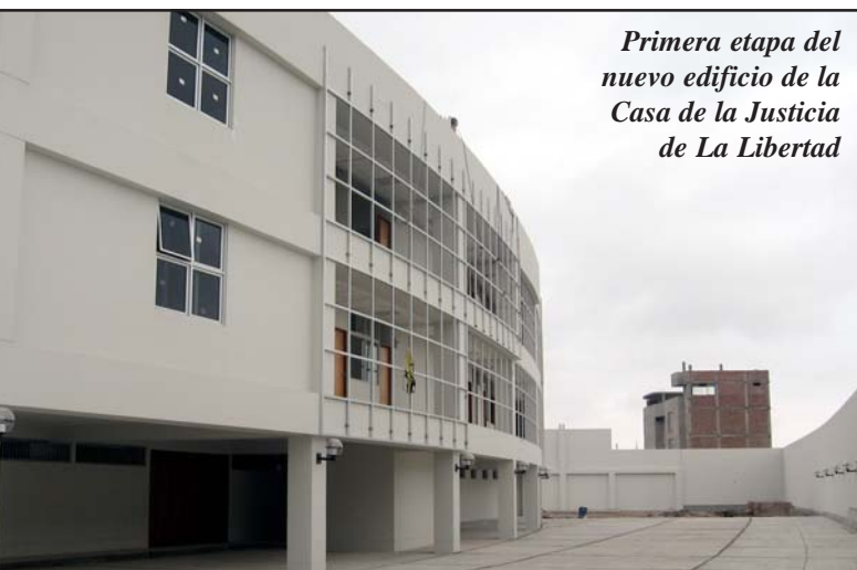
Primera etapa del nuevo edificio de la Casa de la Justicia de La Libertad

La corrupción no podrá entronizarse. Los abogados ya no conversarán previamente con el juez a quien verán solo el día de la audiencia y la sentencia. Todo a la luz y vista de todos: «Como citó alguien... en la oscuridad aparecen los roedores y los insectos... La luz los ahuyenta», concluyó.