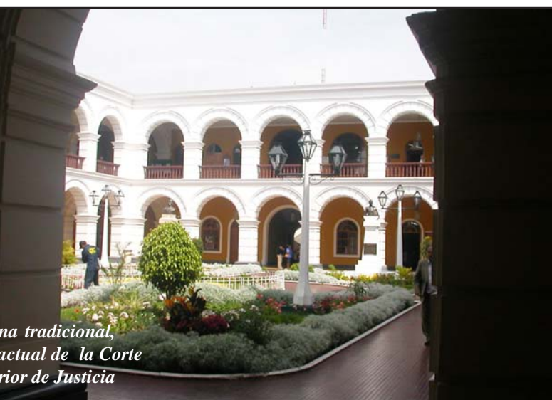
Calle tradicional, actual de la Corte Superior de Justicia