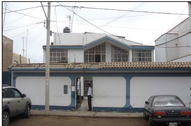
Sede de la Presidencia de la Corte Superior de Justicia de Cañete