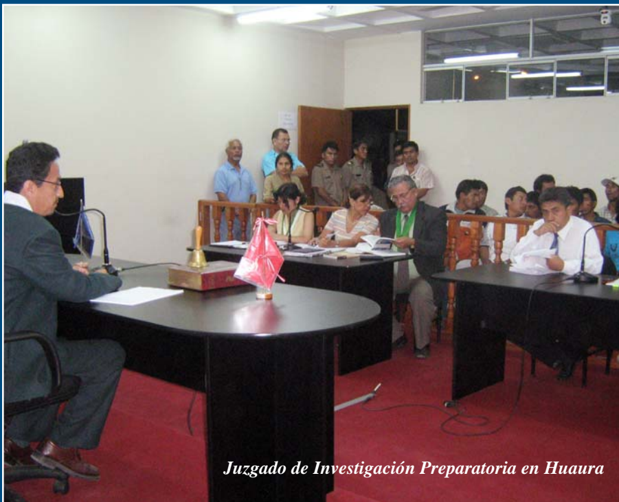
Juzgado de Investigación Preparatoria en Huaura